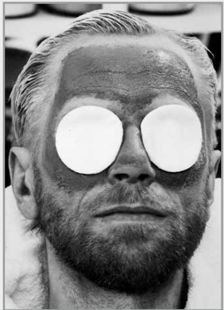
Gesichter meines Lebens 1