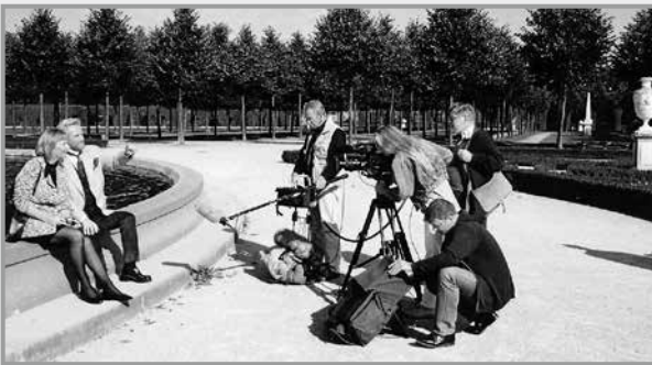
Bei den Dreharbeiten mit dem Bayerischen Fernsehen 1999 an alter Wirkungsstätte